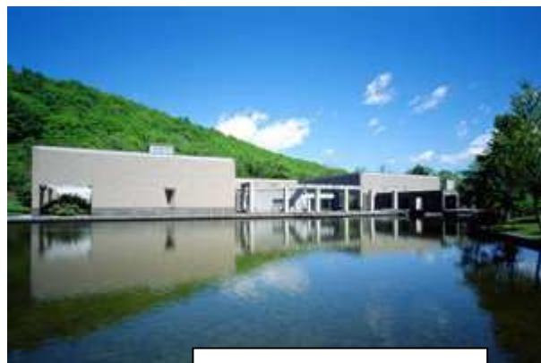
札幌芸術の森美術館