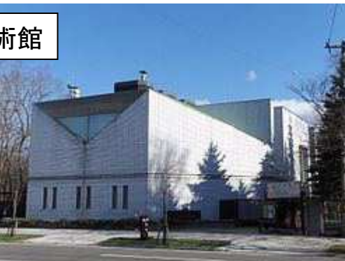
三岸好太郎美術館