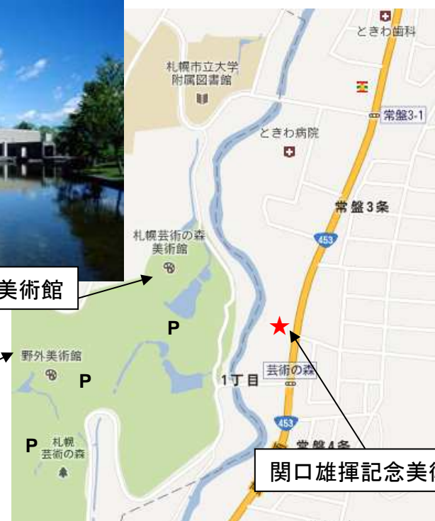
関口雄揮記念美術館