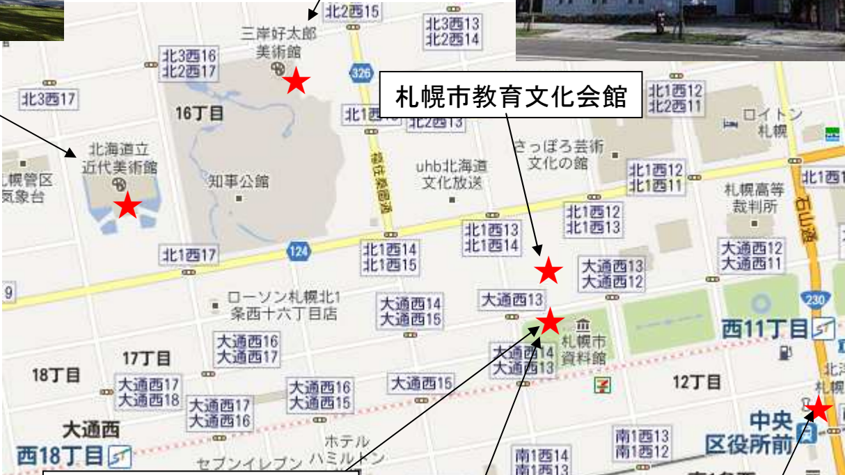
札幌市教育文化会館