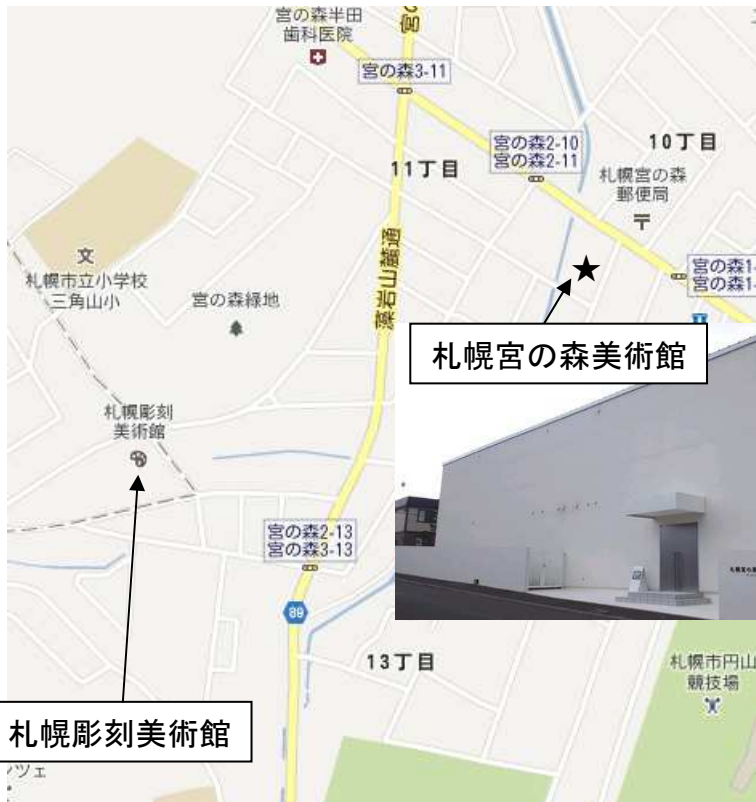
札幌宮の森美術館